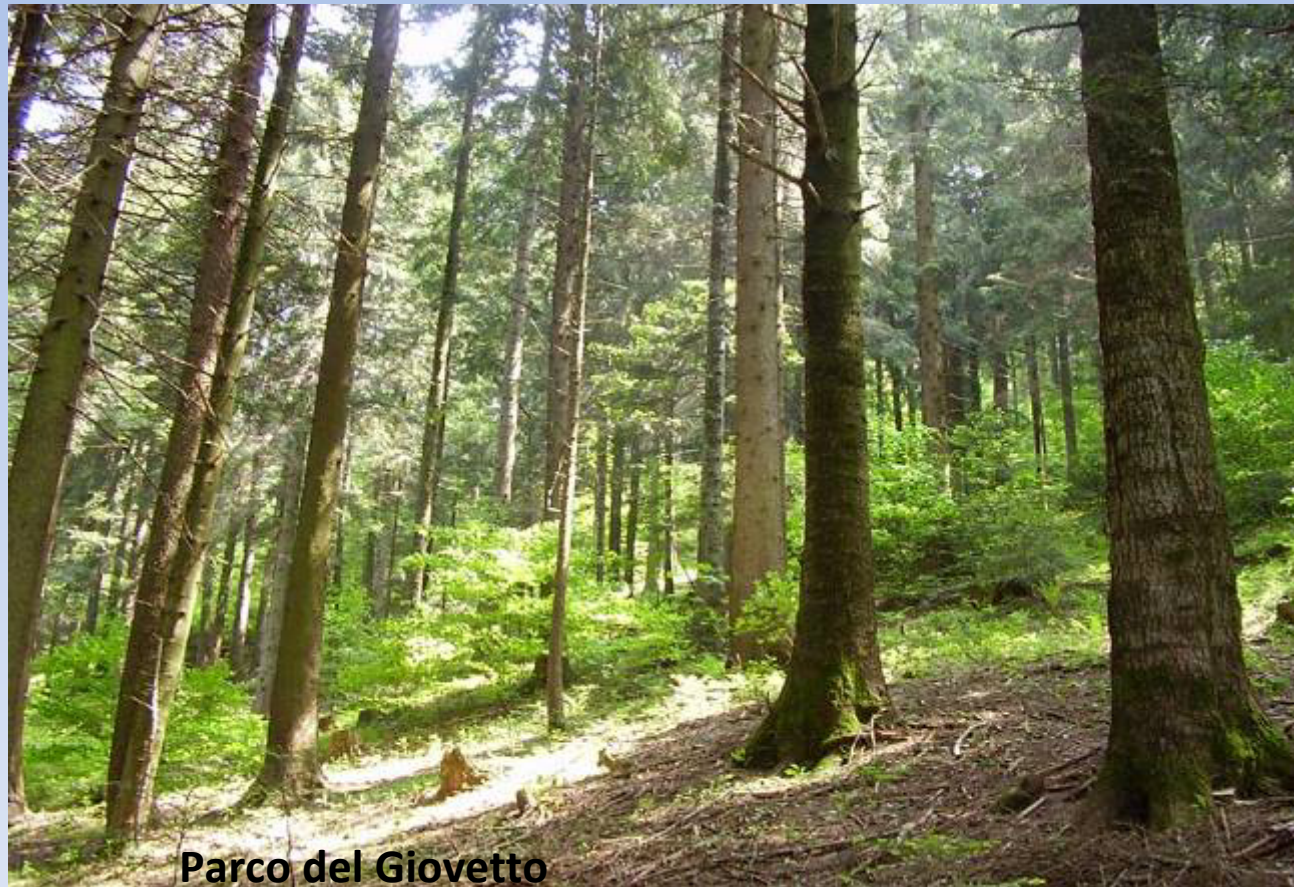
Parco del Giovetto

Studio e valutazione del sito in località "Croce di Salvem-Laghetto Giallo" BORNO BS