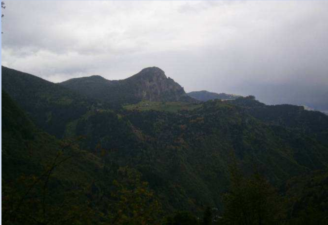
Prave (Sud del laghetto)

Studio e valutazione del sito in località "Croce di Salvem-Laghetto Giallo" BORNO BS