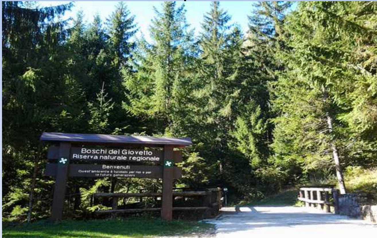
PARCO DEL GIOVETTO (Ovest del laghetto)