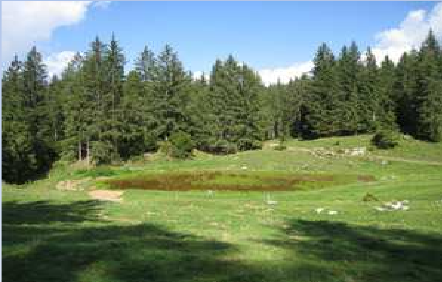
Valsorda (Est del laghetto)

Studio e valutazione del sito in località "Croce di Salvem-Laghetto Giallo" BORNO BS